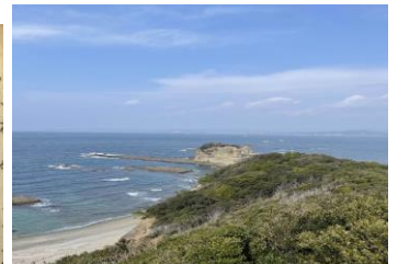
上：高野山 大門 左から：高野山金剛峯寺、高野山での熊楠、熊楠の実家で造られている日本酒、熊楠の実家 世界一統。その下：南方マンダラ、南方熊楠記念館からの眺め