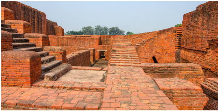
ナーランダラ大学跡遺跡