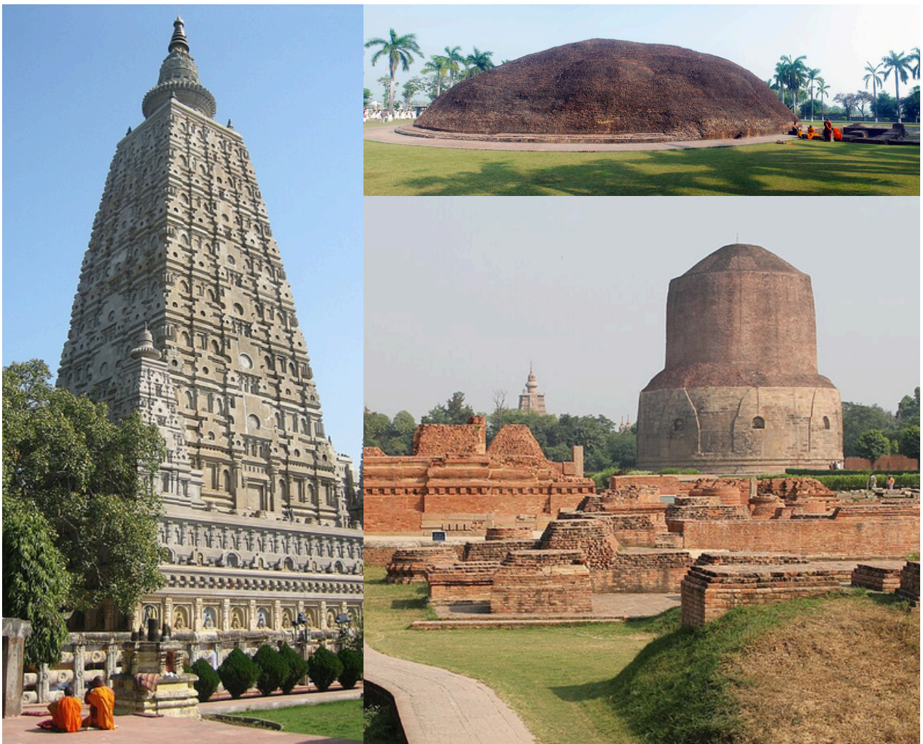
左: マハーボディ寺院 (ブッダガヤー) 右上: ラーマール仏塔 (クシナガル) 右下: ダメク・ストゥーパ (サルナート)