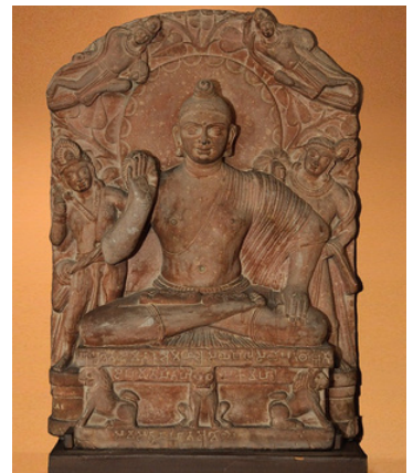
マトゥーラの仏像（マトゥーラ州立博物館蔵）