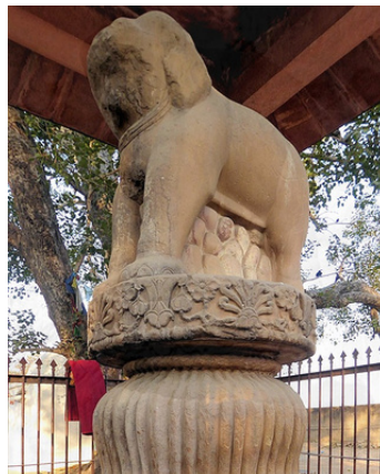
アショカ王の石柱（サンカーシャ）