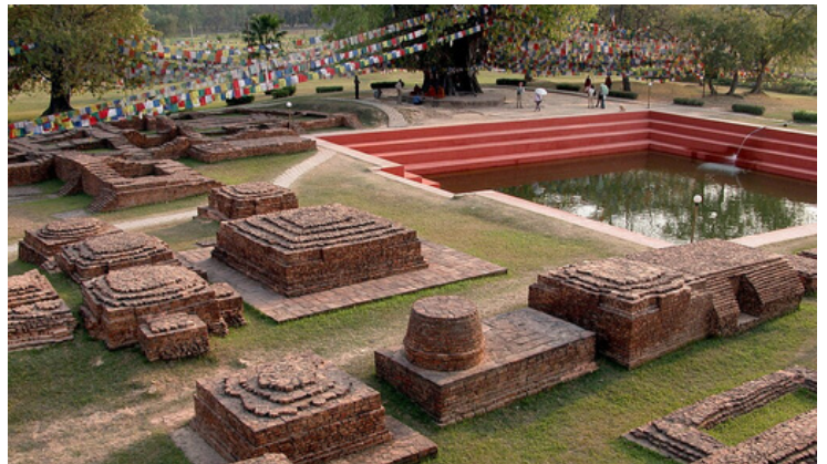
ブスカリニ池（ルンビニー）