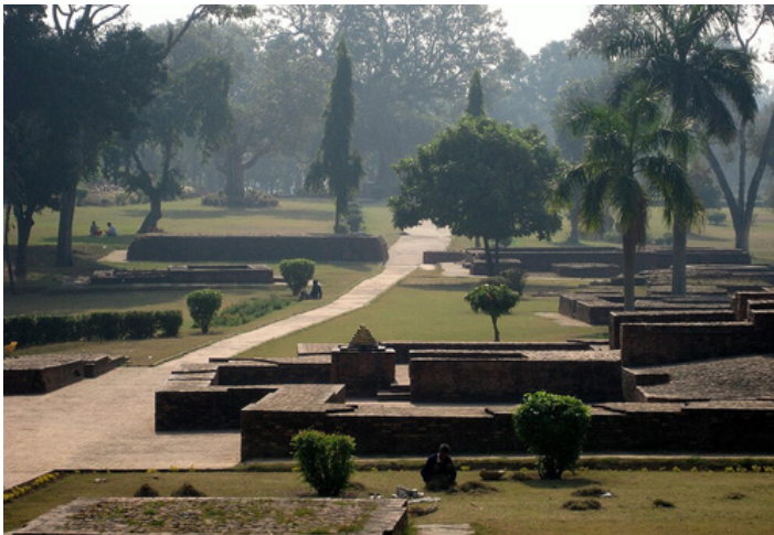
祇園精舎（サハート・マハート）