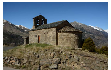
ドーローサン・キルク礼拝堂