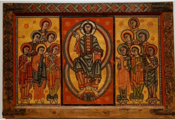
バルセロナ・カタルーニャ美術館→ サン・ペレ教会の祭壇板絵