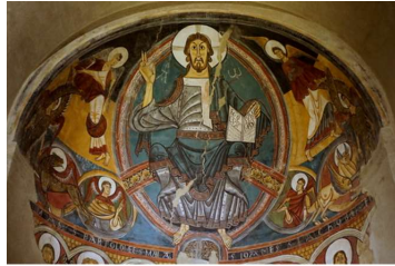
荘厳のキリストー タウイのサン・クリメン教会より