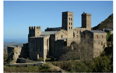
サン・ペレ・デ・ロデスの修道院