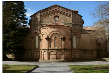
サン・ジョアン・デ・レス ・アバデセッスの修道院教会