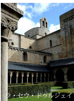
ラ・セウ・ドゥルジェイ ー大聖堂の回廊