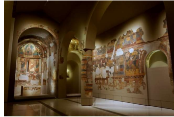
タウイのサンタ・マリア教会より