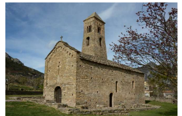
オリウスーサン・エステーブ教会