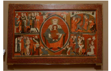
ビラセカの祭壇板絵