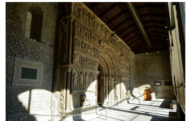
リポイーサンタ・マリア修道院の ファサードの浮彫