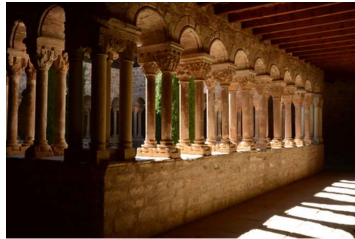
レスタニの修道院の回廊