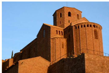
カルドナーサン・ビセンス教会