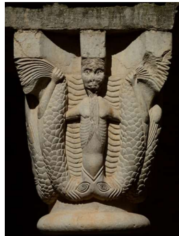
人魚ーサン・ペレ・デ・ ガリガンツ教会の回廊