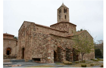
テラッサーサン・ペレ教会