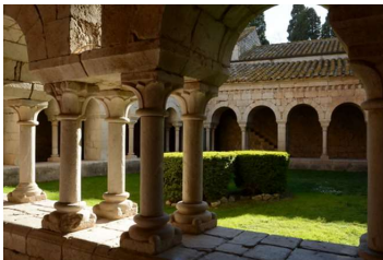
ビラベルトランの修道院の回廊