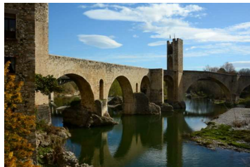
ベサルーフルビア川に架かる石橋