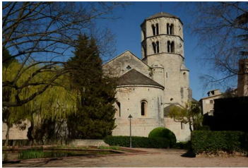
ジロナ→ サン・ペレ・デ・ガリガンツ教会