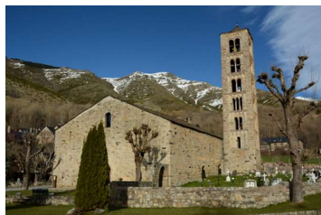
タウイ→サン・クリメン教会