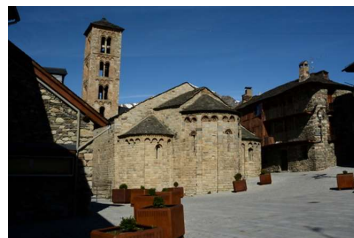
サンタ・マリア教会