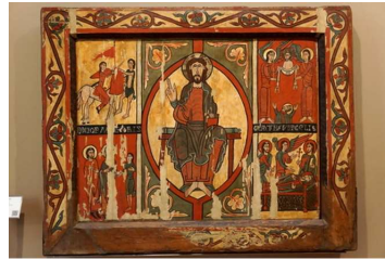
ビック司教区美術館→ プッチボの祭壇板絵