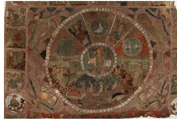
「天地創造のタペストリー」 ージロナ大聖堂美術館