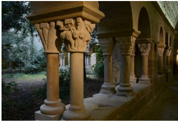
サン・ベネット・デ・バジェス 修道院の回廊