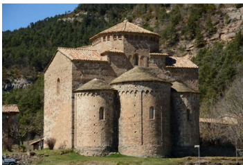
フロンタニャーサン・ジャウメ教会